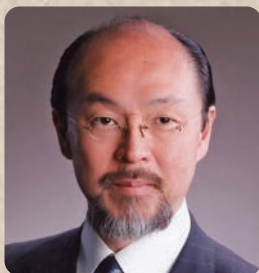
渋谷 寛 氏(パネリスト)

環境省自然環境局総務課 動物愛護管理室 室長。1992年環境庁入庁。自然保護系技官として、国立公園、世界自然遺産、野生生物保護管理等に長く従事。2015年7月より現職。